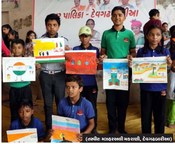
(તસ્વીર: મહારાજાલી મહારાણી, દેવગઢબારીઆ)

(પ્રતિનિધિ) દેવગઢબારીઆ, દેવગઢબારીઆ નગરપાલિકા દ્વારા આઝાદી કા અમૃત મહોત્સવ અન્વયે હર ઘર તિરંગા થીમ આધારિત ત્રિ-દિવસીય સાંસ્કૃતિક કાર્યક્રમોનું આયોજન કરવામાં આવ્યું છે. જેમાં શાળા-કોલેજો અને નાગરિકો મોટી સંખ્યામાં જોડાયા છે. શનિવારના રોજ રણછોડરાય મંદિર સભા મંડપ ખાતે મહંદી હરીફાઈ અને ચિત્ર સ્પર્ધાનું યોજાઈ હતી. જેમાં શાળા-કોલેજોના ૫૫૦ વિદ્યાર્થીઓ સહિત ઓપન વિભાગમાં નાગરિકોએ પણ ભાગ લીધો હતો. જેમાં શાળા-કોલેજોની દીકરીઓએ આઝાદી કા અમૃત મહોત્સવ થીમ આધારિત મનમોહક મહંદી મૂકીને સૌના દિલ જીતી લીધા હતા. ચિત્ર સ્પર્ધામાં પણ હર ઘર તિરંગા અભિયાન અને નગરની