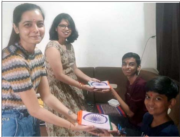
‘હર ઘર તિરંગા’ અભિયાનની અસર રક્ષાબંધનના તહેવાર ઉપર પણ વર્તાઈ છે. ભાઈના હાથ ઉપર રાખડી બાંધી પોતાની રક્ષાનુવચન માંગી બહેનોએ, ભાઈને તિરંગા ભેટ આપી પોતાની સાથે માંભોમની આન, બાન, અને શાનની રક્ષા અને ગૌરવ બાળવાનું પણ વચન લીધું હતું.

સંઘ પ્રદેશ, દા.ન.દ., દમણ- દીવ, ભરૂચ, સુરત, નવસારી, વલસાડ, ડાંગ જુલ્હાના સમાચારો