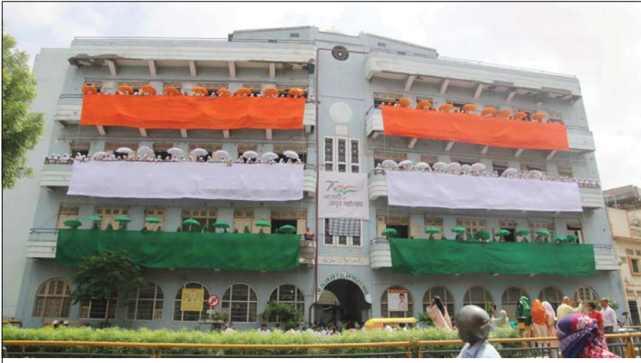
સરકાર દ્વારા હર ઘર તિરંગાના કાર્યક્રમ અંતર્ગત અમદાવાદના દાણાપીઠ પાસે આવેલી અંબુમન ઇસ્લામિક સ્કૂલને તિરંગાથી સજાવી છે