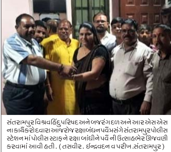
સંતરામપુર વિશ્વવહિંદુપરિષદ અને બજંગઘડળ અને આરએસએસ ના કાર્યકરો દ્વારા આજરો રક્ષાબંધન પર્વ પ્રસંગે સંતરામપુર પોલીસ સ્ટેશન માં પોલીસ સ્ટાફને રક્ષાબંધન પર્વની ઉલ્લાસભરે ઉજવણી કરવામાં આવી હતી.